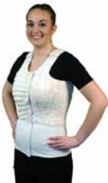
Veste avec rembourrage total facultatif (avec options de rembourrage vertical et horizontal sur l'illustration)

10 $ à une adresse commerciale 13,25 $ à une adresse résidentielle