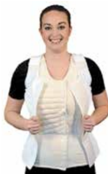
Veste avec JoViJacket